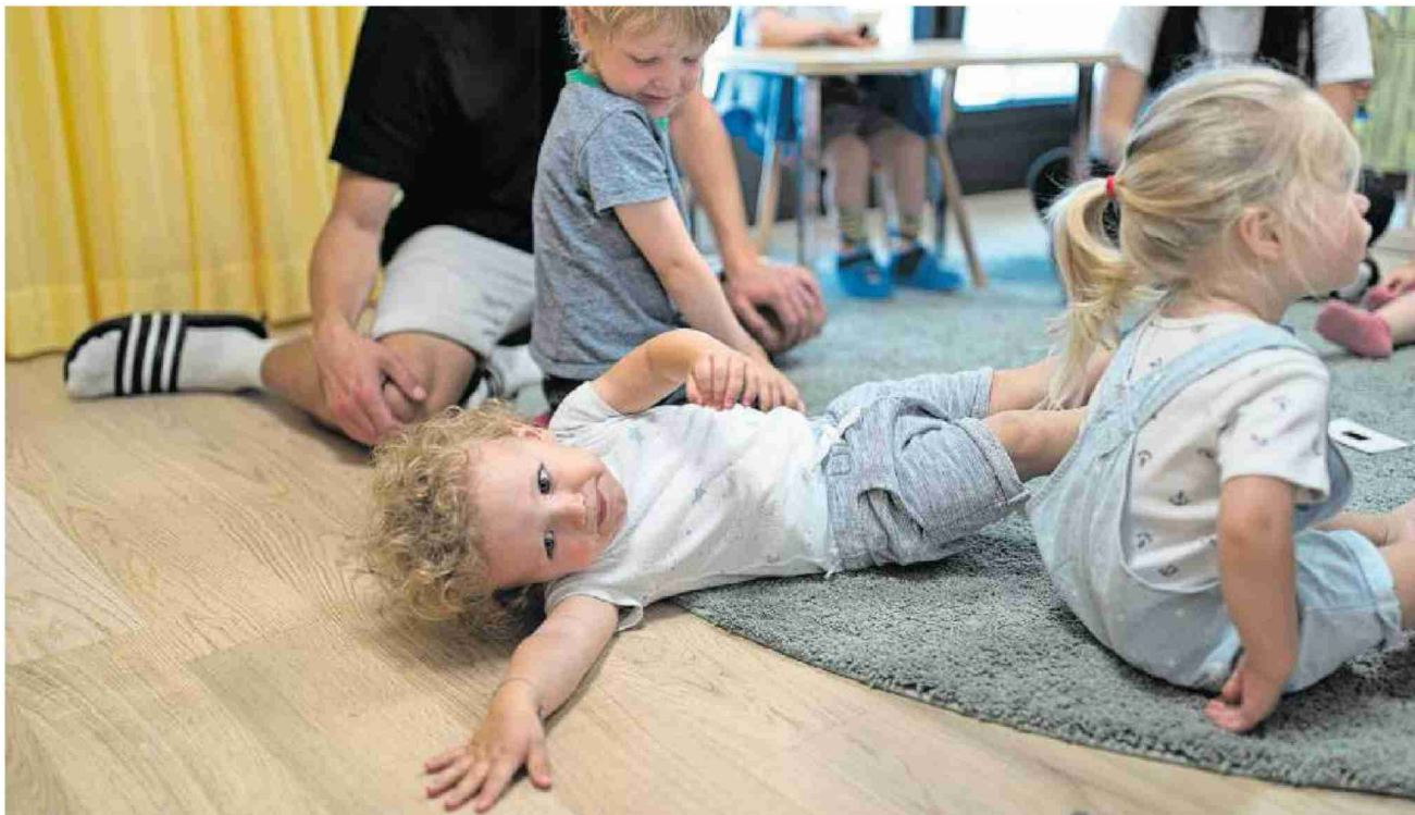
Krippenkinder verdienen später durchschnittlich mehr: Spielende Kinder in einer Zürcher Kindertagesstätte. (9. Juli 2020)