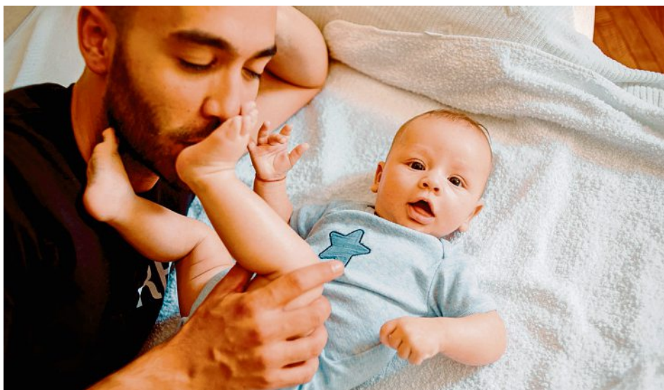
La Suisse est l'un des derniers pays développés à ne rien accorder aux nouveaux pères.

La réglementation actuelle n'est plus suffisante. Un jeune père obtient un jour de congé à la naissance de son enfant, soit autant que lorsqu'il déménage... L'introduction d'un congé paternité de deux semaines est un signal fort pour les familles, il est compatible avec l'économie et finançable. La Suisse est le seul pays d'Europe qui ne connaît ni congé paternité (pour les pères) ni congé parental (à partager entre la mère et le père). À quelques semaines des élections fédérales, le sujet a passionné le National, puisqu'une soixantaine d'élus ont pris hier la parole avant d'accepter le principe