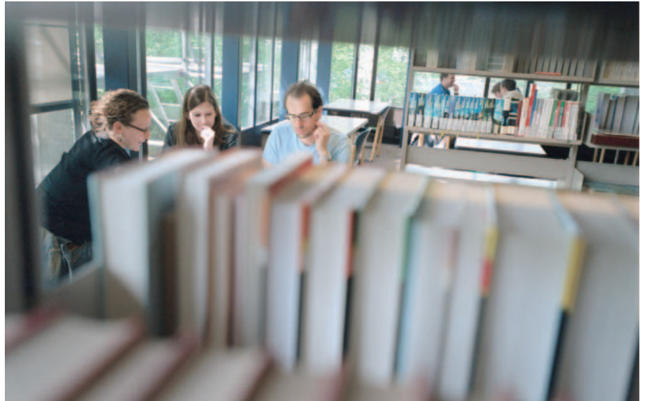
Une pétition dénonce l'obligation d'utiliser l'anglais dans les demandes de financement du Fonds national.

Le conseiller national Mathias Aebischer (PS, BE), président de la commission de la science, de l'éducation et de la culture, estime «inadmissible qu'un organisme financé par l'Etat rende l'anglais obligatoire au détriment des langues nationales». Le socialiste valaisan Mathias Reynard (PS, VS), membre de la même commission, fait le lien avec la polémique sur le choix de la première langue étrangère enseignée à l'école. «Le FNS donne un message très négatif en