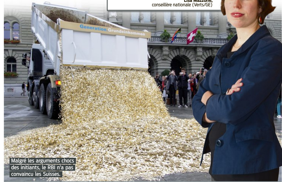
Malgré les arguments chocs des initiants, le RBI n'a pas convaincu les Suisses.

Lisa Mazzone, conseillère nationale (Verts/GE)