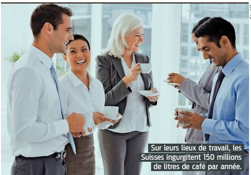
Sur leurs lieux de travail, les Suisses ingurgitent 150 millions de litres de café par année.