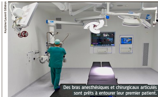
Des bras anesthésiques et chirurgicaux articulés sont prêts à entourer leur premier patient.